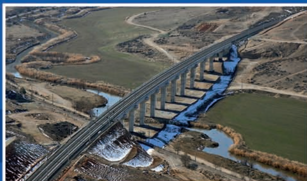
Línea de Alta Velocidad Ankara-Estambul, Turquía.