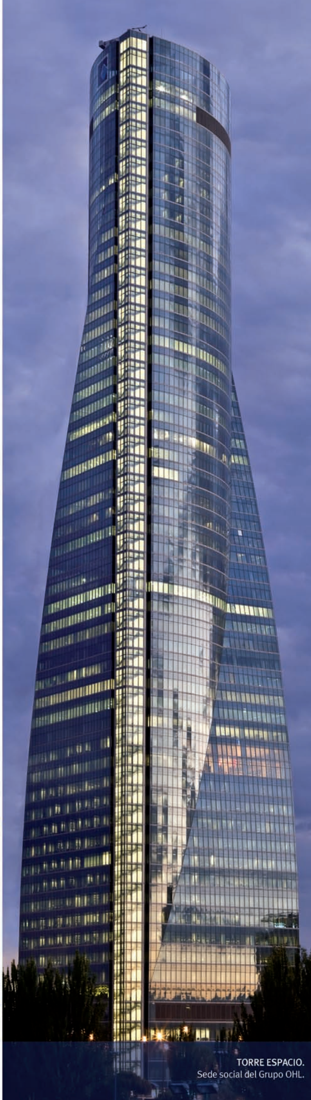
TORRE ESPACIO. Sede social del Grupo OHL.